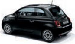
876 Vesuvio Schwarz