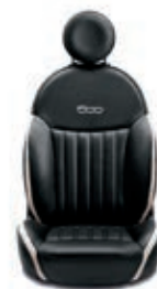
Leder Schwarz/Elfenbein 598