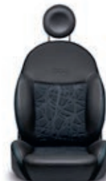
Seaqal™ Schwarz 544