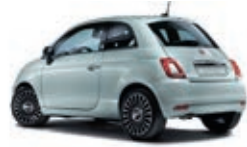
196 Rugiada Grün