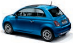
425 Italia Blau