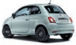
196 Rugiada Grün