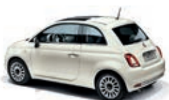
227 Bianco Ghiaccio