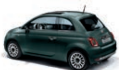
421 Verde Rockstar Opaco