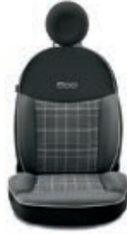
Nero / Grigio