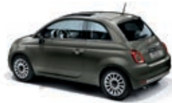
372 Grigio Colosseo