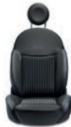
Nero / Blu