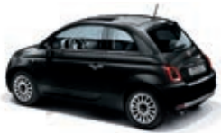
876 Nero Vesuvio