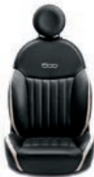
Pelle Nera / Avorio