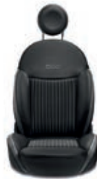
Nero / Titanio