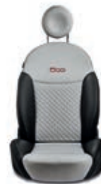
Bianco / Nero