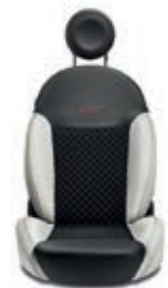
Nero / Bianco