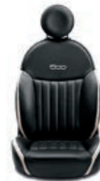
Pelle Nera / Avorio