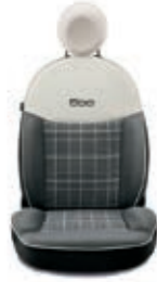
Grigio / Avorio