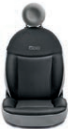
Grigio Scuro / Grigio Chiaro