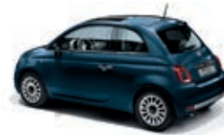
687 Blu Dipinto di blu