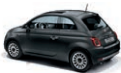
735 Gris Carrara