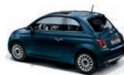
687 Bleu Dipinto di Blu