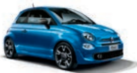
425 Bleu Italia