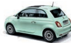
166 Vert Lattementa