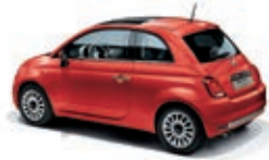
552 Corallo Rot