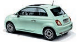
166 Lattementa Grün