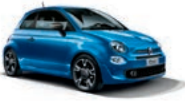
425 Italia Blau