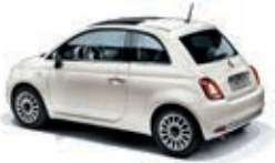
268 Gelato Weiss