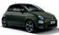
149 Alpen-Grün Matt (mit 6U9)