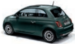
421 Rockstar Grün Matt