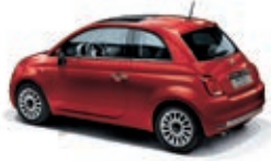
111 Passione Rot