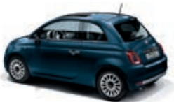
687 Dipinto di blu Blau