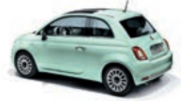
166 Lattementa Grün