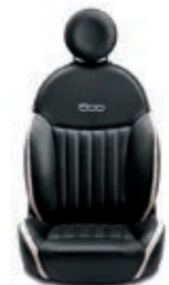
Leder Schwarz/Elfenbein 598