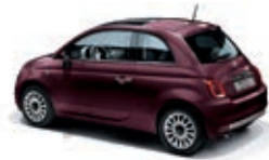
866 Opera Bordeaux