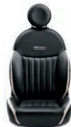
Leder Schwarz/Elfenbein 686/687