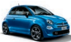
425 Italia Blau