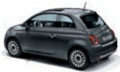
695 Pompei Grau