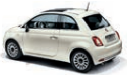
227 Ghiaccio Weiss