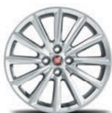
124 Spider Lusso