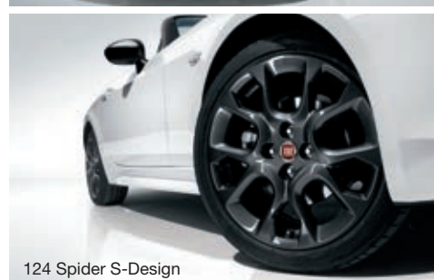
124 Spider S-Design