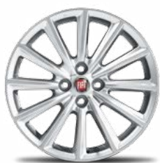
124 Spider Lusso